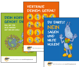
Neuaufgabe der Plakate für Grundschulen