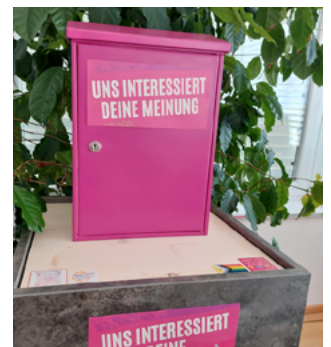
Aktion Pinker Postkasten in Mittelschule und Jugendbüro