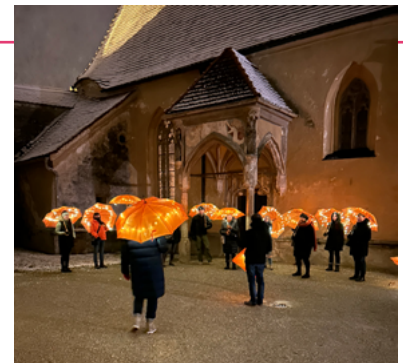
Orange Walk zum 25. November