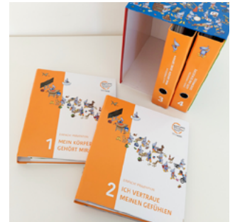
Ordnerreihe zur Prävention